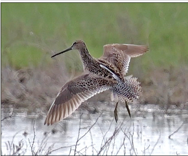
Фото 1–3. Американский бекасовидный веретенник. Под Шпиндияр у с. Макаровка Херсонской области. 7.05.2021 г.